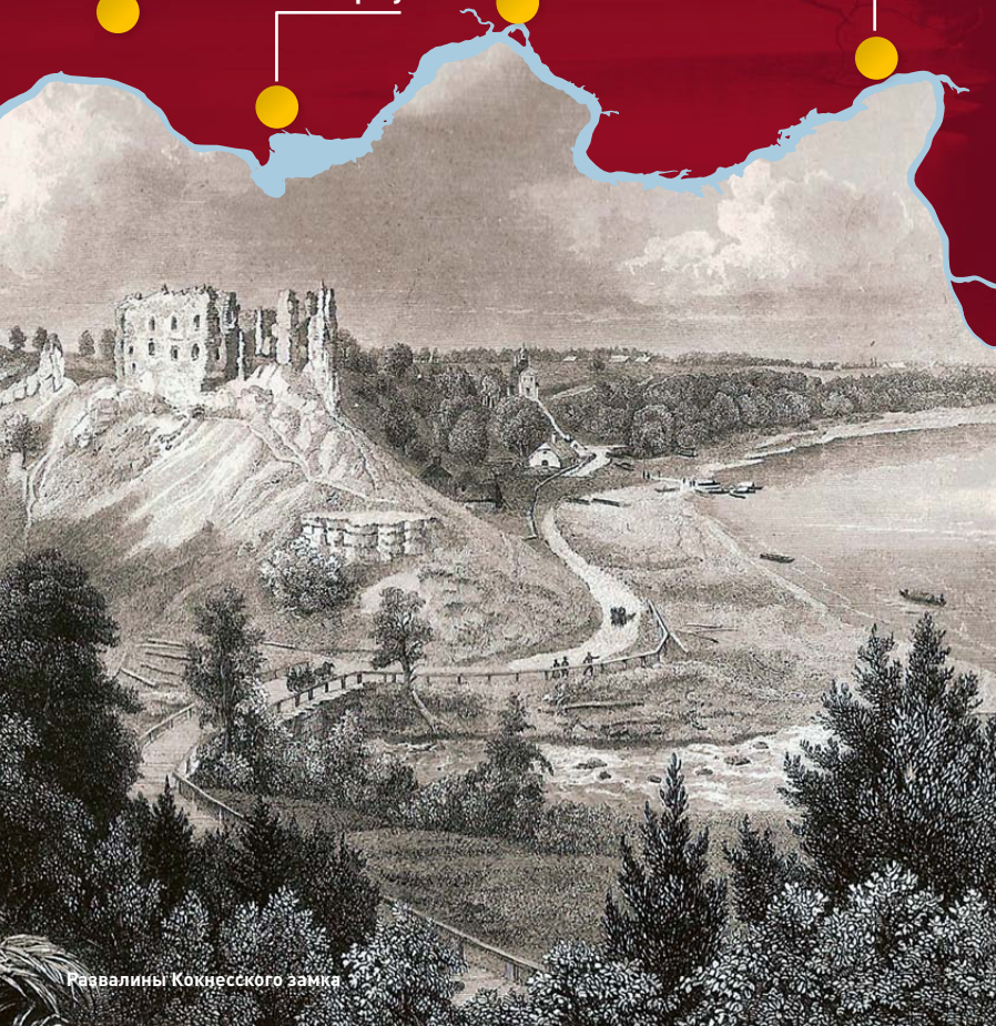
Руины Кокнесского замка